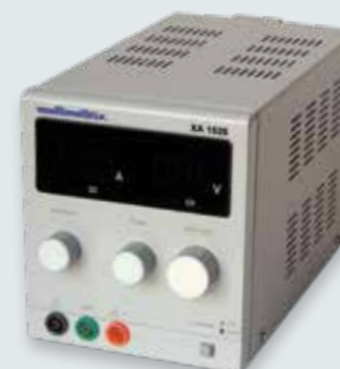
Pour commander XA1525