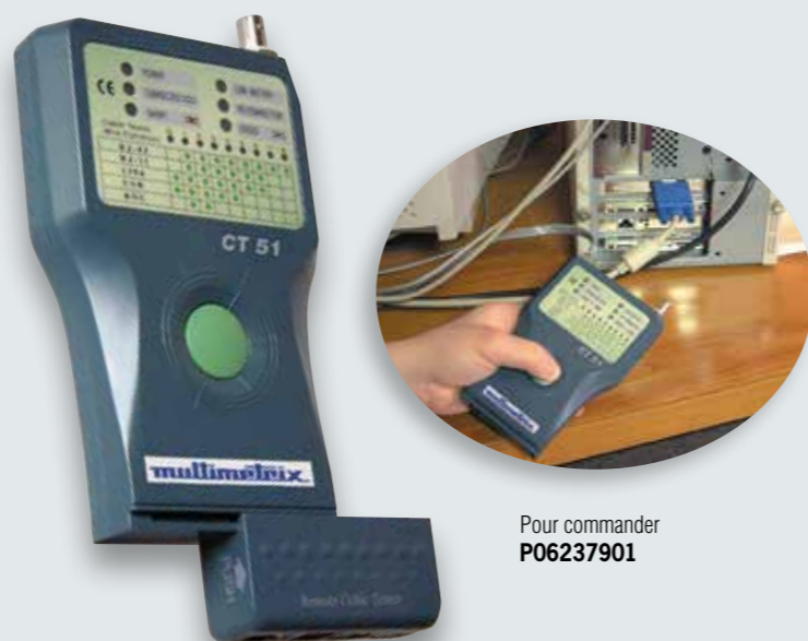
Pour commander P06237901

Dimensions / Masse : 200 x 100 x 27 mm / 280 g (tout inclus) Fourni avec adaptateurs câbles et 1 pile 9 V