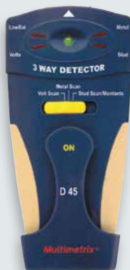
Pour commander P06237902

Ne percez plus à l'aveugle dans vos cloisons en contre-plaqué ou en bois