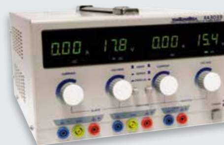
Pour commander XA3033