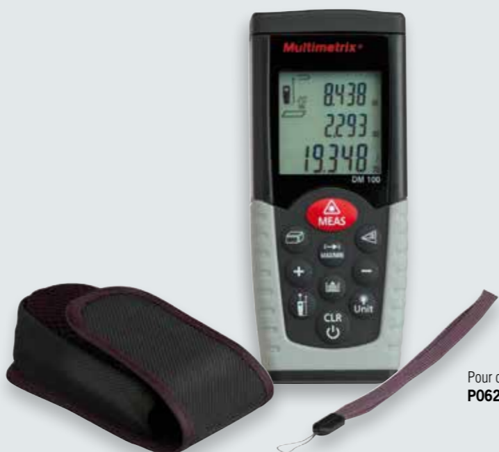
Pour commander P06237503Z

Dimensions / Masse : 115 x 48 x 18 mm / 135 g Fourni avec une pile 9 V, une notice de fonctionnement, une dragonne et une sacoche de transport