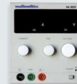
Pour commander XA3051