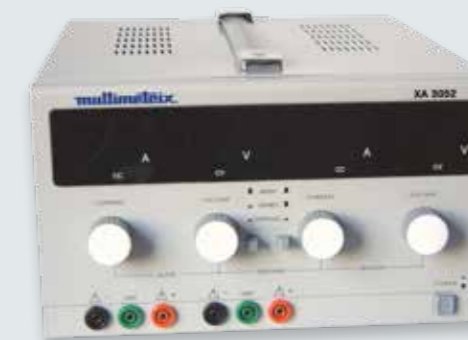
Pour commander XA3052