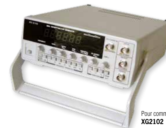
Pour commander XG2102